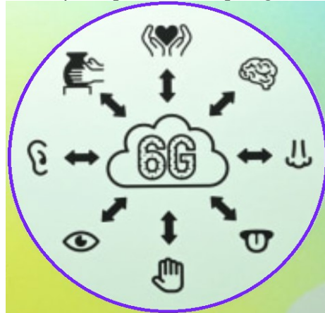
Fig. 3. Posibilitatea de a împărtăși corpul, abilitățile, ...

experiență, forma supremă de comunicare, cum ar fi telekinezia, împărtășirea gândurilor și emoțiilor și telepatia, care permite acțiuni specifice doar prin gândire, va fi realizat.